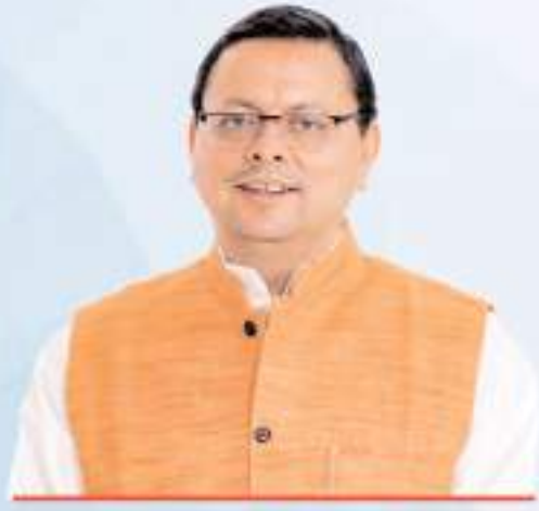
पुष्कर सिंह धामी मुख्यमंत्री, उत्तराखण्ड